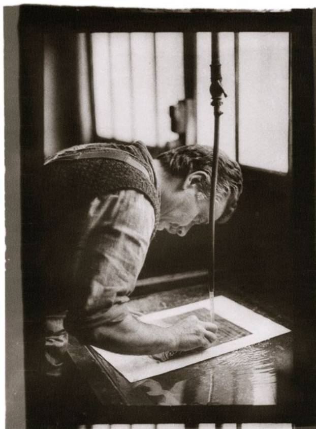
1. Bernard Plossu Pierre Fresson dans l'atelier vers 1971