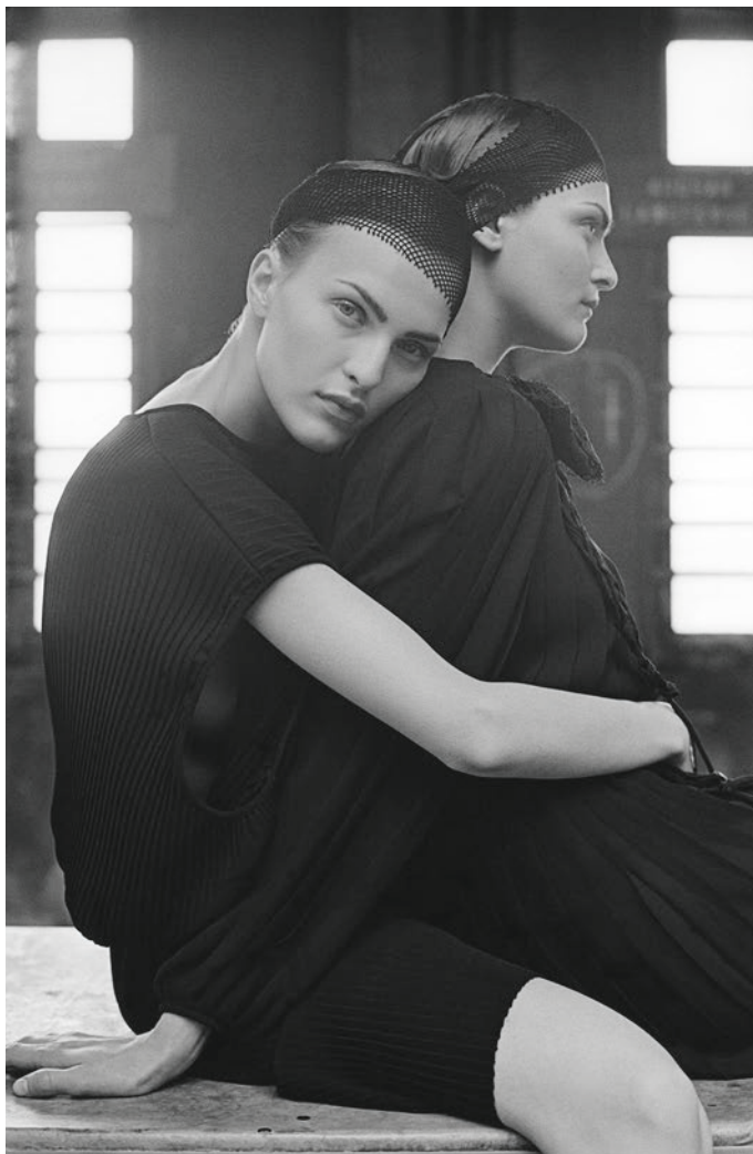
6. Les Robes Noires [pour Elle ] 2001 Tirage sur papier au gélantino-bromure d'argent