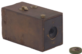
The Kodak camera, 1888

Inventé en 1888 par l'industriel américain George Eastman [1854-1932], l'appareil Kodak est révolutionnaire !