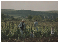
Anonyme, Mortières, vigne, contre-jour début du XX e siècle

Inventé par les Frères Lumière en 1904 , l'autochrome est le premier procédé qui rend la photographie couleur accessible à de nombreux amateurs . Reposant sur le principe de la trichromie , l'autochrome a l'avantage d'être plus simple. Finie la superposition complexe de trois films transparents ! L'image est enregistrée sur une seule plaque.