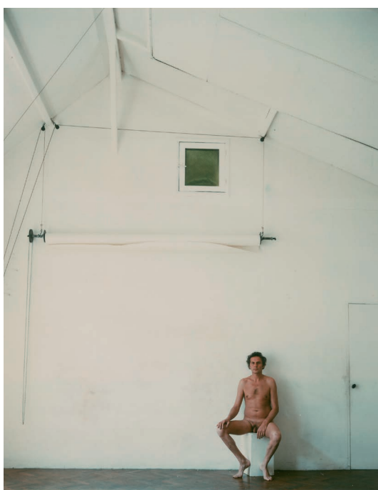
16. Jean-François Bauret Autoportrait, nu dans son atelier années 1980 polaroid