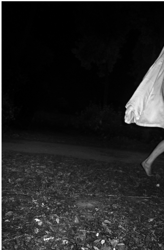
4. Alexandra Catiere Jacinta 2014