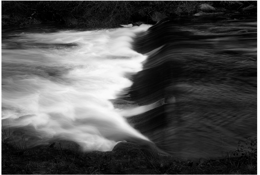
3. Alexandra Catiere La rivière 2017 © Alexandra Catiere