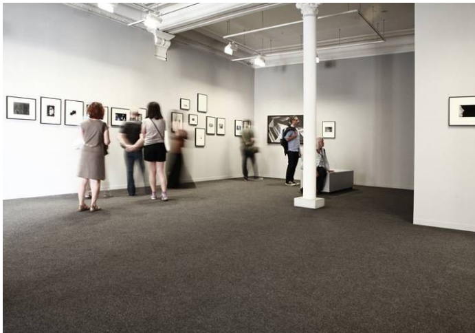
Exposition d'Alexandra Catière, Lauréate 2011 aux Rencontres d'Arles 2012

BMW s'engage dans un véritable accompagnement: de la création à la production d'œuvres, jusqu'à leur diffusion aux Rencontres d'Arles et à Paris Photo et à travers l'édition d'un livre.